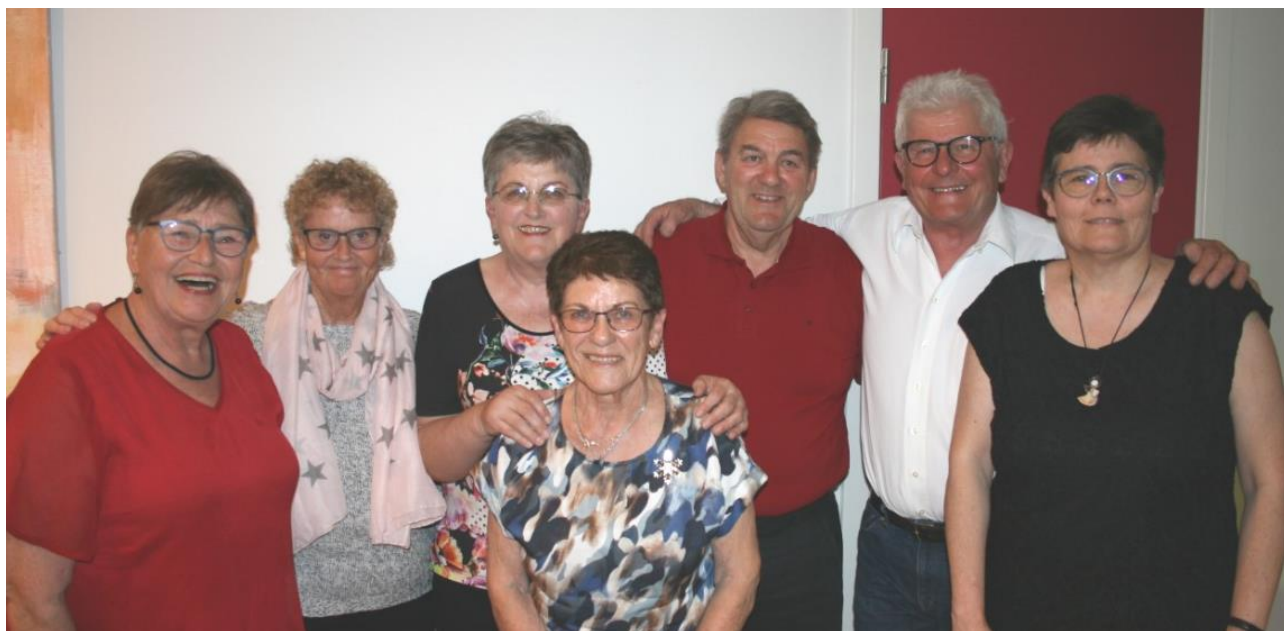
Den nye bestyrelse, valgt på generalforsamlingen i marts 2019