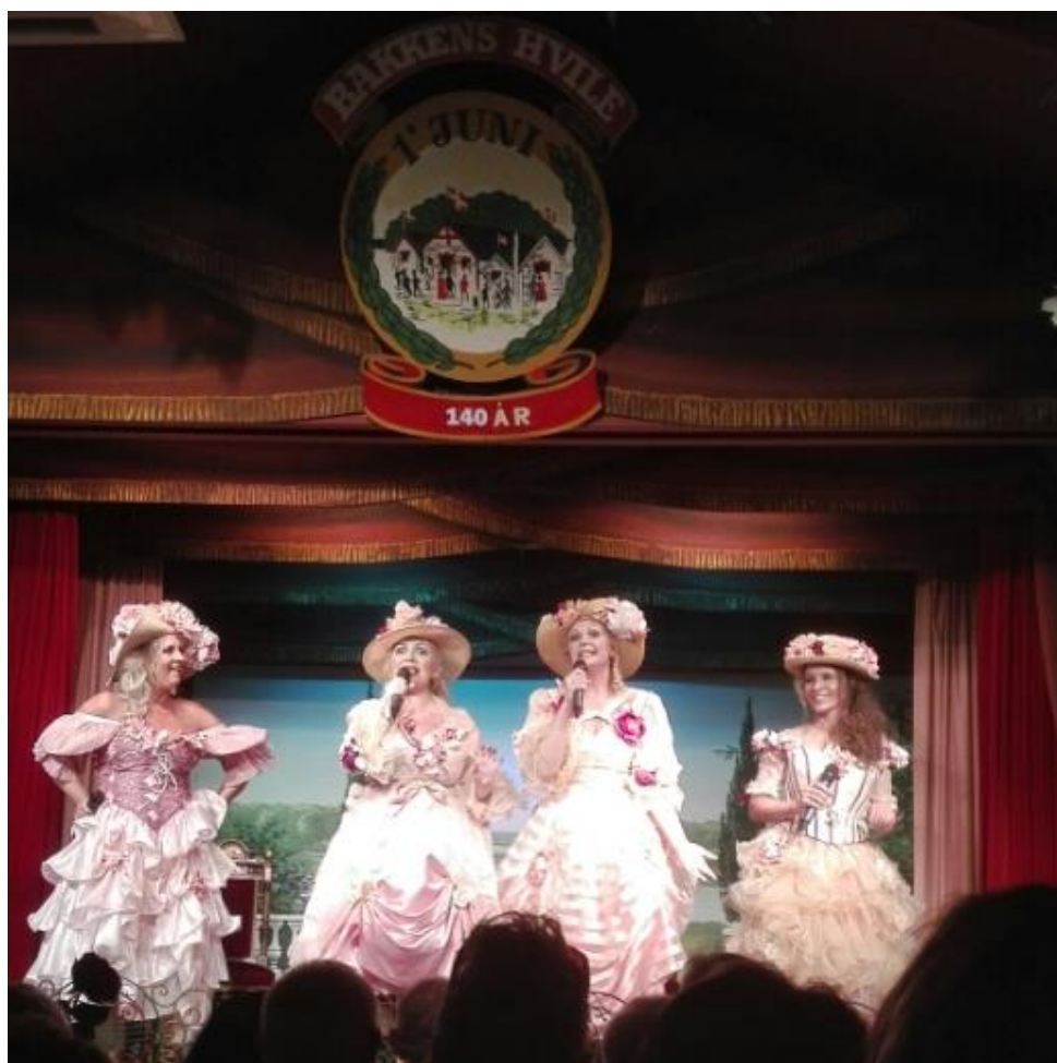
Oplagte Bakkepiger den 31.maj 2017