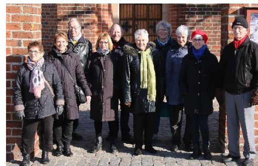
Fra rundvisningen i Højbyen