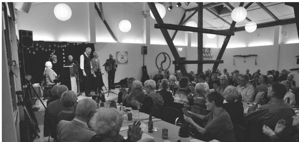
Juleviseaftenen 2017, foto Jens Olaf Madsen.